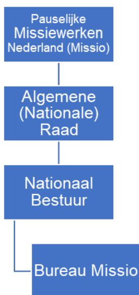
Afbeelding 1: Organogram van Pauselijke Missiewerken Nederland

Stichting Pauselijke Missiewerken Nederland. De statuten zijn voor het laatst gewijzigd op 17 augustus 2004. Deze stichting voert het bestuur over de Stichting Pauselijk Missiewerk voor de Geloofsverbreding; de Stichting Pauselijk Missiewerk voor eigen priesters; en de Stichting Pauselijk Missiewerk der kinderen. De statuten van deze drie stichtingen naar kerkelijk recht zijn voor het laatst gewijzigd op 27 november 1990.